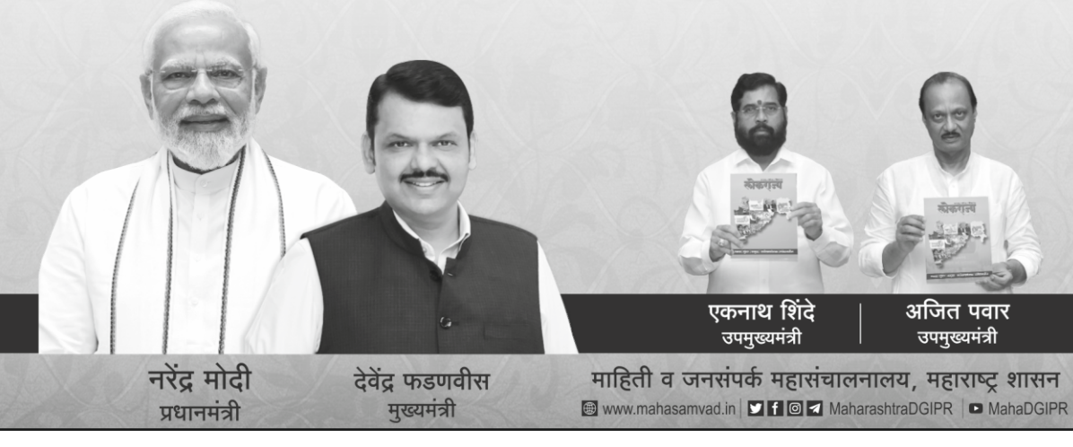
नरेंद्र मोदी प्रधानमंत्री

डॉ. बाबासाहेब आंबेडकर यांच्या विचारांचा आणि कार्याचा वारसा जपत सर्वसमावेशक, प्रगत आणि न्याययुक्त महाराष्ट्र घडविण्याचा संकल्प करूया.